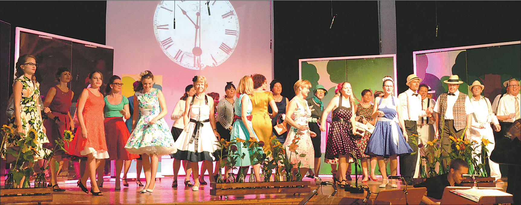
In Kostümen der 50er-Jahre verzauberte der Coro Cantarina mit seinem Gesang das Publikum.